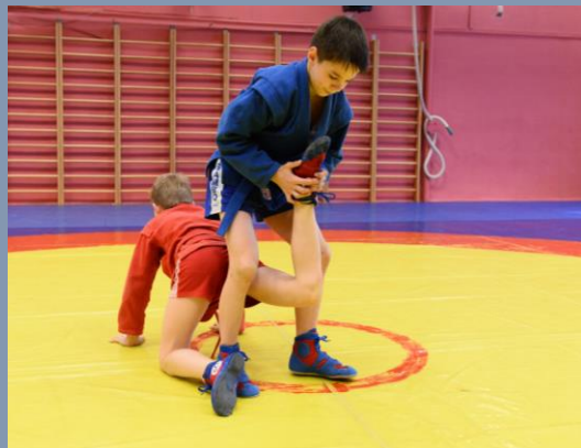
Болевой прием «УЗЕЛ БЕДРА»

для возрастных категорий: 11-12 лет, 12-14 лет, 14-16 лет